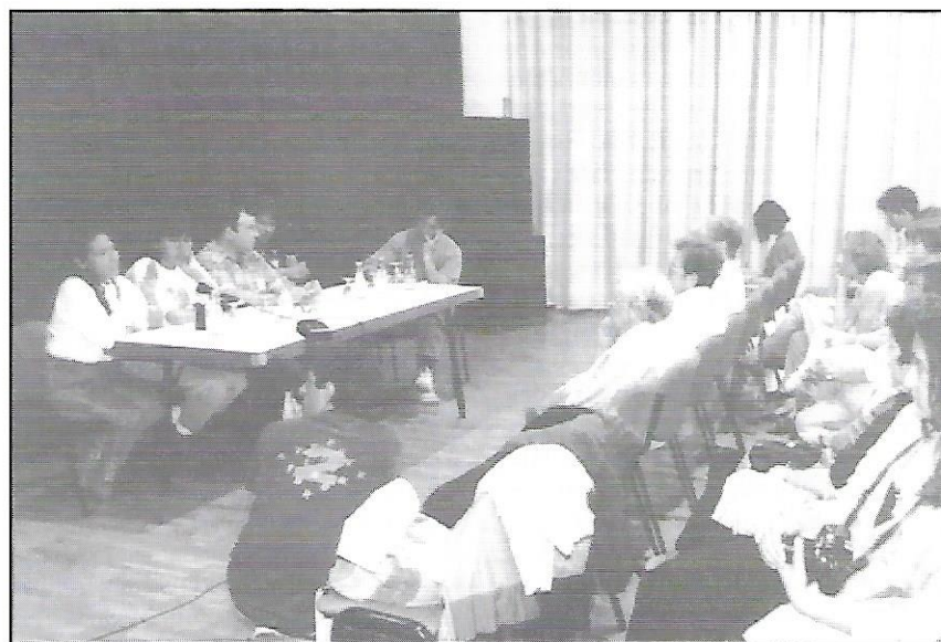
Les Jornades Indigenistes van tenir una bona resposta per part del públic.

De la diversitat de postures, el doctor en Antropologia social i cultural,